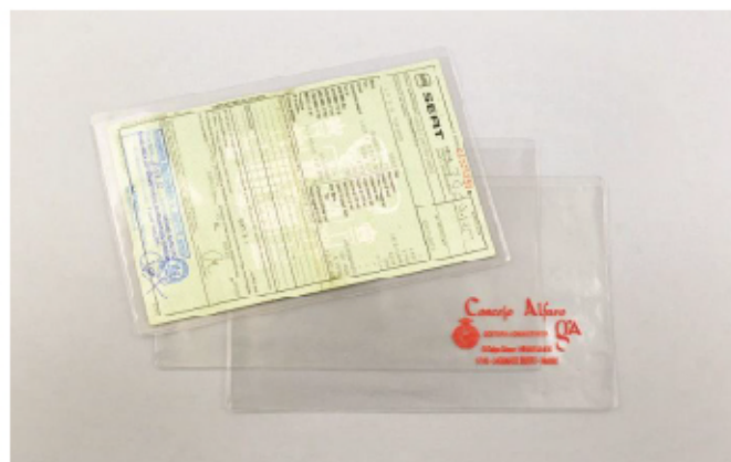
FUNDA PERMISO CIRCULACION A5 TRANSP

FUNDA PERMISO CIRCULACION ABERTURA SUPERIOR A5 232X165 MM PVC COLOR 300 MICRAS PVC TRANSPARENTE 150 MICRAS IMPRESIÓN 1 TINTA