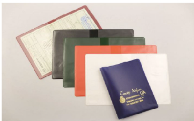
FUNDA PERMISO CIRCULACION A5 OPACO

FUNDAS PERMISO CIRCULACION ABERTURA SUPERIOR A5 232X165 MM PVC TRANSPARENTE 150 MICRAS IMPRESIÓN 1 TINTA