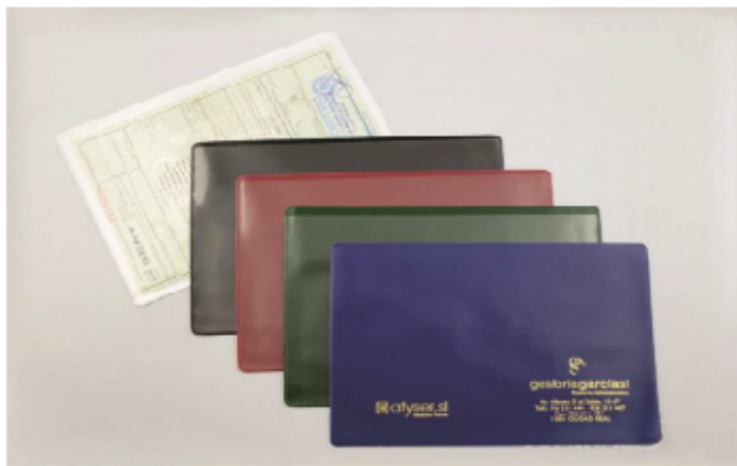
FUNDA PERMISO CIRCULACION A5 OPACO